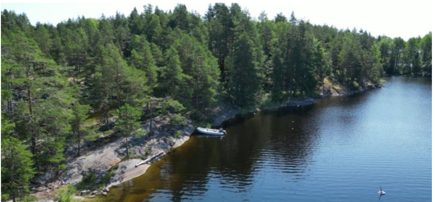
Vettä ja maisemaa riittää kalliorannoilla

Heinävedellä sijaitsevat Pohjoismaiden ainoat ortodoksiset luostarit, Valamon munkkiluostari ja Lintulan nunnaluostari. Me kuitenkin jätimme luostarit väliin ja pistäydymme Heinäveden kirkolla syömässä päivän jo käännyessä iltaan. Seuraava leiripaikka oli retkisaari nimeltään Martinsaari. Se sijaitsee Heinäveden selän jälkeen tulevassa niemenkärjessä. Tämän jälkeen reitti onkin kapeaa ja mutkaista kanavilla kyllästettyä väylää. Kuten jo alkuvaiheessa huomasimme, ei täälläkään ruuhka häirinnyt, vaan olimme ainoat satamassa olijat, siis rauhaa ja luontoa