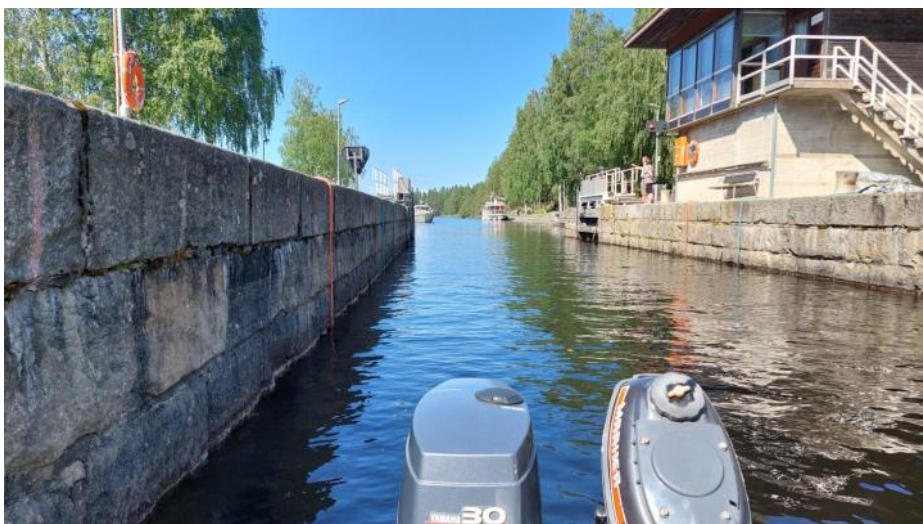
Karvion kanavan ruuhkaa

tarjolla jälleen. Teltan paikka oli hiukan katselussa, koska valmiita telttapaikkoja ei ollut tarjolla. Teltta saatiin kuitenkin mukavaan varvikkoon ja sitten olimmekin valmiit viihtymään laavulla nuotiotulen äärellä. Meille sattuikin aitiopaikka, sillä parahiksi Saimaan historiallisten höyrylaivojen regatta purkautui pikuhiljaa ohitsemme. Istuimme niemenkärjellä todellista kansallismaisemaa ihailen pitkälle yön tunneille läm-