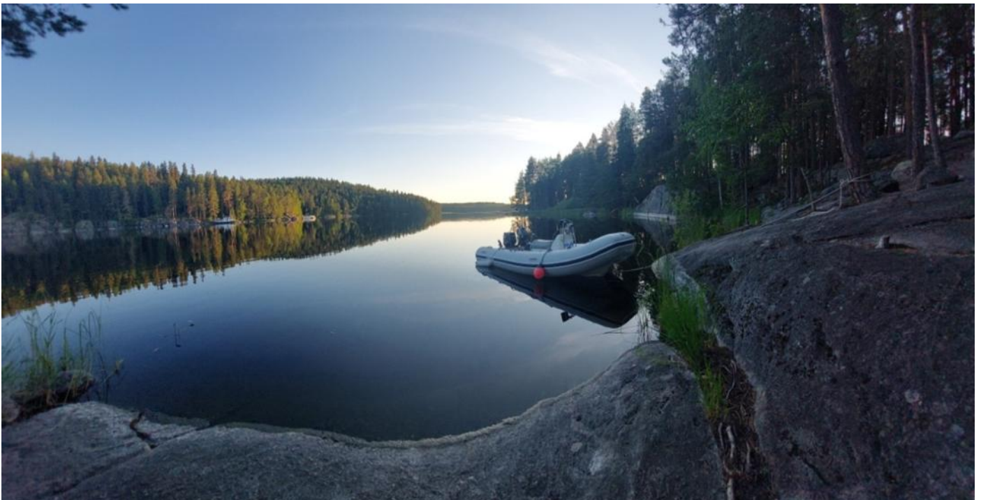
Luonnon- ja mielenrauhaa Kolovedellä

olimmekin perillä. Paikka on vanha iso metsätila, jossa aivan viehättävä ja ystävällinen pariskunta asuu ja pitää vierasmajoitusta. Isäntä on perehtynyt kuusilajeihin ja tilalla kasvaa muistaakseni seitsemää eri kuusilajia, etäisimmät Kanadasta asti tuotuja. Emäntä puolestaan on menestynyt aikoinaan metsätaitokilpailuissa. Isäntäväki oli perin puhe- liasta ja niinpä aika kului rattoisasti heidän tarinoitansa kuunnellessa. Kävimme myös tutkimassa myös luonnossa eri kuusilajeja, joita oli istutettuna eri puolille. Paikassa on aiemmin ollut myös vieraslaituri, mutta kuten nimikin kertoo, paikka on kapeahkossa salmessa ja ohiajavat veneet ja laivat pitävät rannan rauhattomana. Niinpä isäntäväki on